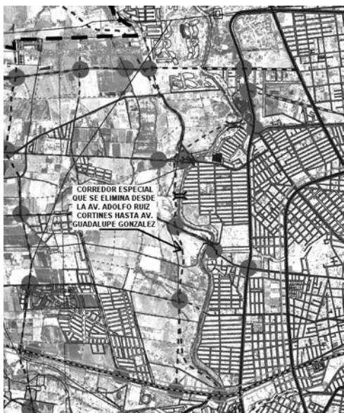
IMAGEN DE VIALIDAD SECUNDARIA PROPUESTA EN SUSTITUCIÓN DEL CORREDOR ESPECIAL