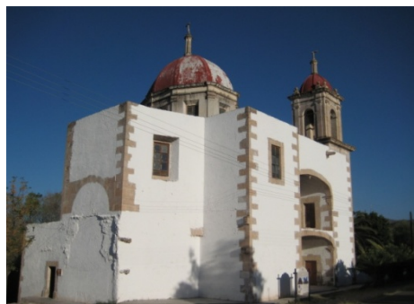
IGLESIA DE PALMITOS