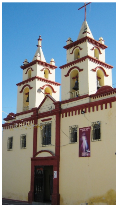
IGLESIA DE ABASOLO