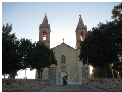
TEMPLO EL SANTUARIO