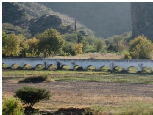
ACUEDUCTO DE PALMITOS