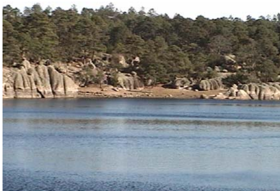
Lago de Arareco

Cuenta con atractivos naturales como: el Lago de Arareco, Caída El Salto, Presa Sitúriachi, Manantial Recowata, Barranca del Cobre, Barranca Tararecua; los Valles de Monjes, Cuevas Sebastián y San Ignacio; las formaciones de piedra: Valle de los Hongos, San Luis de Majimachi, San Ignacio de Arareco, Bisabirachi, Cerro Rumúrachi, Cuevas de Chomachi, entre muchos otros.