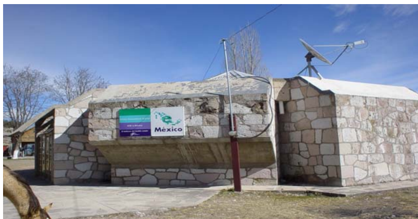
C.C.A DE BOCOYNA

de Sisoguichi, con el fin de acercar los servicios de apoyo a jóvenes estudiantes en los procesos de investigación, por otra parte elaborar programas de computación a Población abierta con el fin de mejorar su instrucción académica y con ésta fomentar el empleo en diferentes ramas de ocupación.